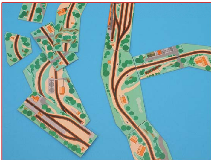
Ci-dessus : jusqu'à ce jour, chaque réseau était bâti avec l'assemblage de croquis au 1/10ème.

Jusqu'à ce jour, les organisateurs dessinaient le plan de chaque module au 1/10ème sur un carton en intégrant le plan de voie. Tous les modules deviennent les pièces d'un puzzle à géométrie variable qui surtout pourra s'adapter à la dimension d'une salle d'exposition ou d'un stand. Les gares de croisement avec leur alimentation sont bien sur réparties dans le réseau. Les éventuelles bifurcations sont placées à des endroits judicieux. Lorsque le réseau est bâti, l'organisateur prend une photo et le tour est joué !