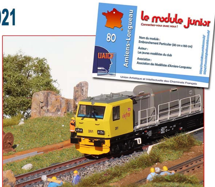
Le Module Junior, d'une largeur de 40 cm avec sa voie implantée au centre du caisson, est présenté en exposition avec une étiquette d'identification.