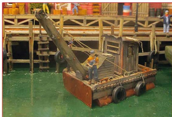
Quelques exemples de petits projets « confinement » avec des matériaux simples : la construction d'un radeau, la construction d'un chargement pour un wagon (voir PLT 126) et la construction d'un heurtoir.

Aujourd'hui, fin mai, les associations ne peuvent pas encore reprendre leurs activités, par conséquent, il devient particulièrement important de maintenir ce lien entre nous et étudier ensemble, dès à présent, les animations de la rentrée pour relancer la vie dans nos associations.