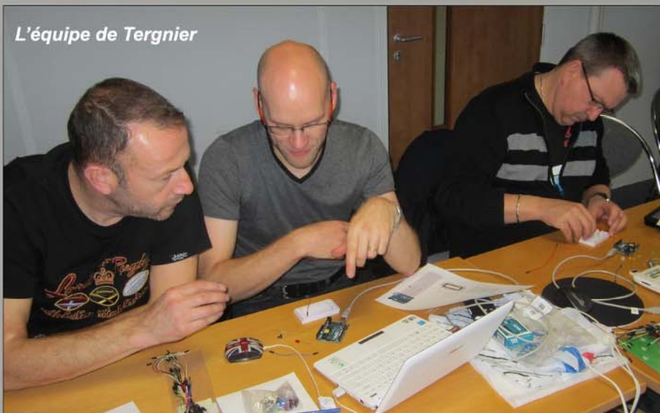
L'équipe de Tergnier