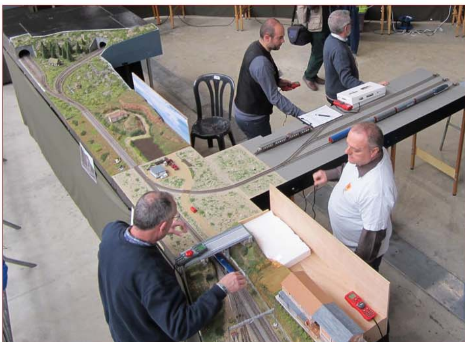
Ci-dessus : sur le réseau de la FCAF, le faisceau de formation des trains et une boucle de retournement.