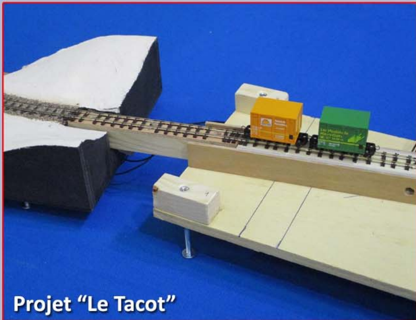
Projet "Le Tacot"