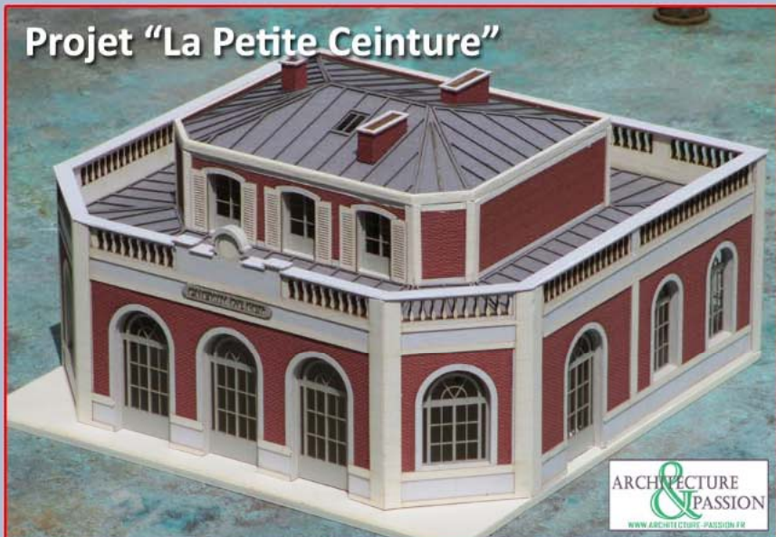
Projet "La Petite Ceinture"