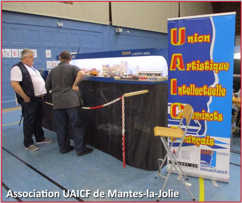
Association UAICF de Mantes-la-Jolie