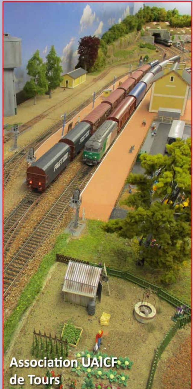
Association UAICF de Tours