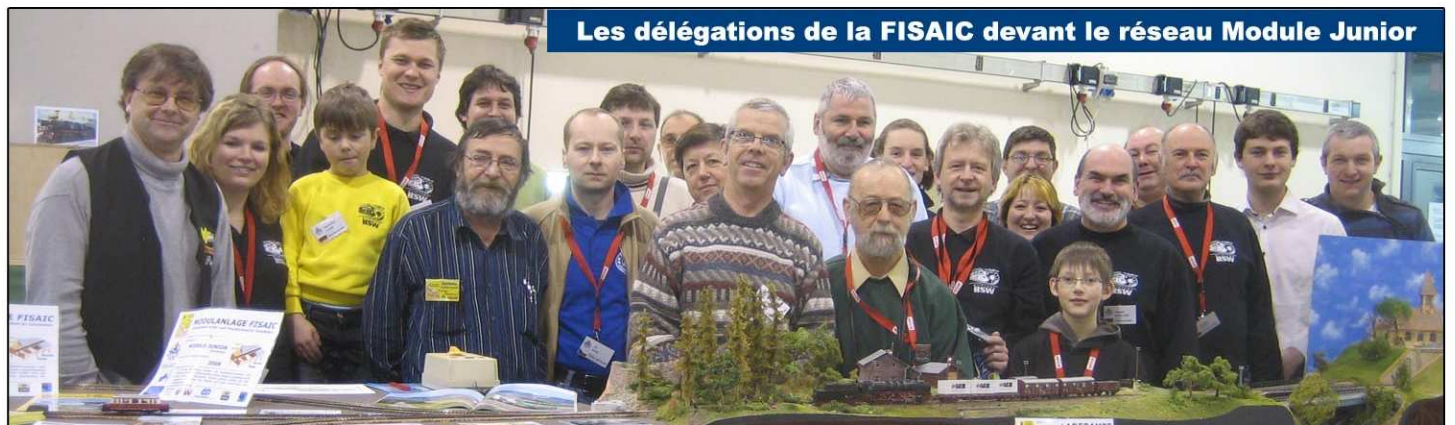
Les délégations de la FISAIC devant le réseau Module Junior

L'édition 2011 des cheminots modélistes s'annonce tout aussi pertinente que la rencontre de Dresde, puisque les organisateurs envisagent une manifestation placée sous le signe du patrimoine dans le musée des chemins de fer tchèques de « Luzna u Rakovnika » les 24 et 25 septembre 2011. Le Module Junior sera également de la fête. Réservez dès à présent votre participation à ce rendez-vous européen en contactant votre délégué régional de la commission modélisme et patrimoine ferroviaire de l'UAICF. PL