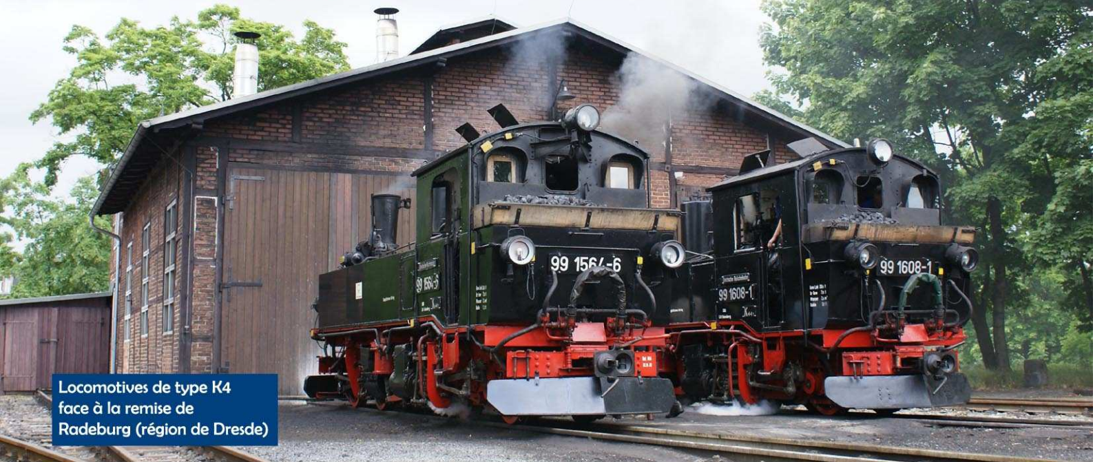
Locomotives de type K4 face à la remise de Radeburg (région de Dresde)

Au niveau de la Commission Nationale Modélisme et Patrimoine Ferroviaire, nous avons présenté aux responsables de l'UAICF, en juin dernier, 4 projets pour 2010. L'Europe , avec le premier déplacement d'un groupe de cheminots UAICF dans une exposition FISAIC, le Partenaïat avec les CER avec l'organisation d'un nouveau TechnoRail, l'Initiation avec un Rassemblement des Modules Juniors à Paris et les Jeunes avec un séjour culturel et linguistique franco-allemand à Chartres.